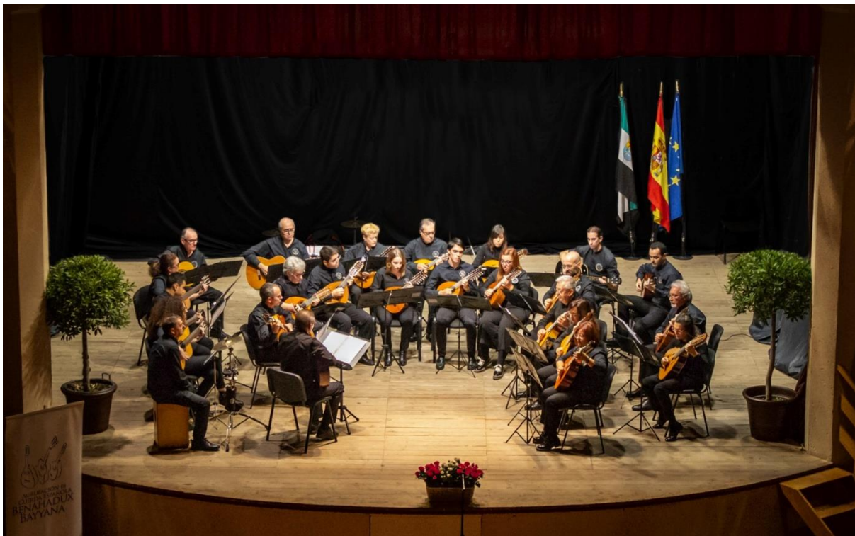
Agrupación Musical Benhadux-Bayyana.