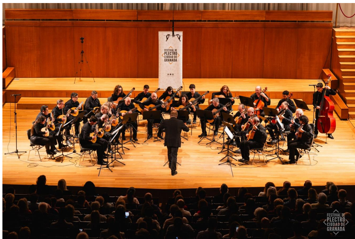
Orquesta de Plectro Torre del Alfiler. IV FPCG 2024.