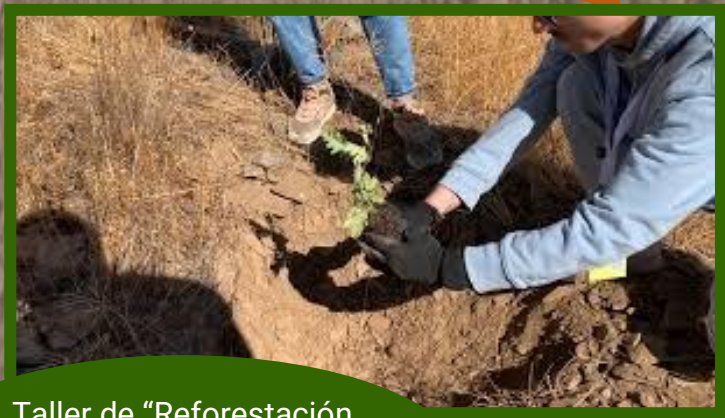
Taller de "Reforestación ambiental en Montevideo" 2023