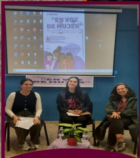
Ponente en la tertulia "En Voz de Mujer" 2025