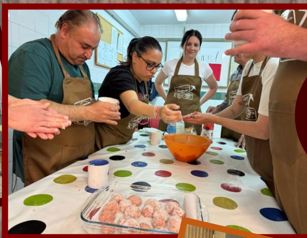
Financiación del Taller de Cocina curso 2025/2026